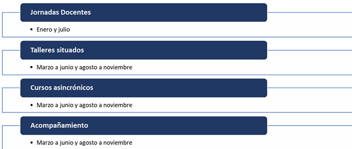
Figura 4. Espacios formativos y sus respectivas temporalidades

Para esquematizar todo lo expuesto, la Figura 4 presenta los espacios formativos y sus respectivas temporalidades. Para la correcta comprensión de la Figura 4 debe siempre tenerse en cuenta la posibilidad de dependencia e independencia, así mismo, debe siempre tenerse en cuenta que la disposición centralizada en la DIDOC está afecta a la solicitud o necesidad particular de las facultades, escuelas y/o carreras.