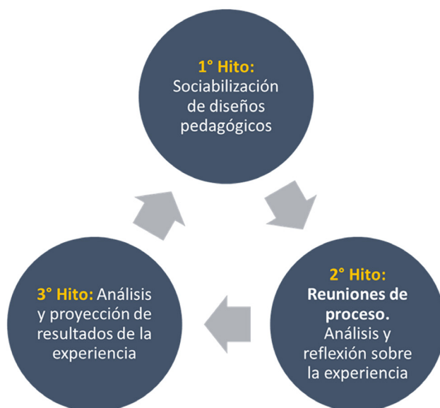
Figura 3. Circuito interaccional de los acompañamientos

En términos generales, los acompañamientos mantienen una estructura interaccional de tres hitos (como se advierte en Figura 3) que favorecen tres acciones genéricas: en primer lugar, se socializan los diseños didácticos, luego se analizan fortalezas y debilidades (regulando lo que sea necesario regular) y, finalmente, se revisan los ajustes implementados proyectando mejoras y reflexionando sobre mejoras y aprendizajes significativos.