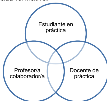
Figura 1: Actores de la triada formativa.

en la tarea docente propiamente tal, recibiendo ambos el soporte del docente de práctica en su condición de representante de la universidad.