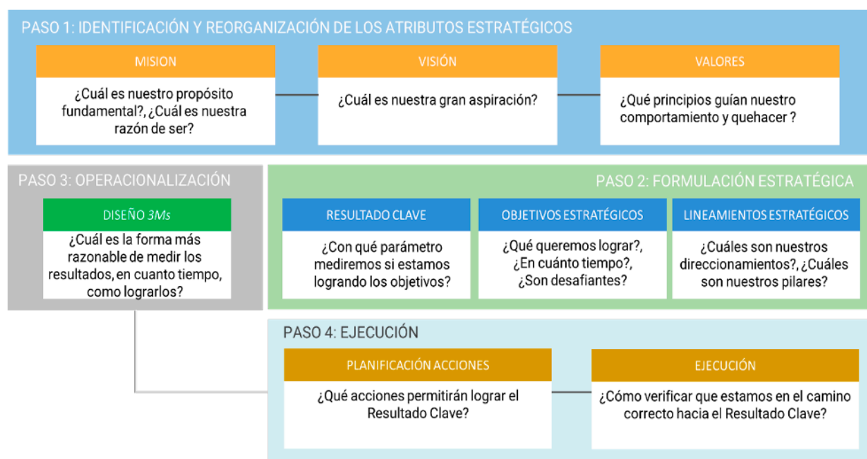
Figura 4: Metodología de ajuste Plan de Desarrollo Estratégico UCSH.