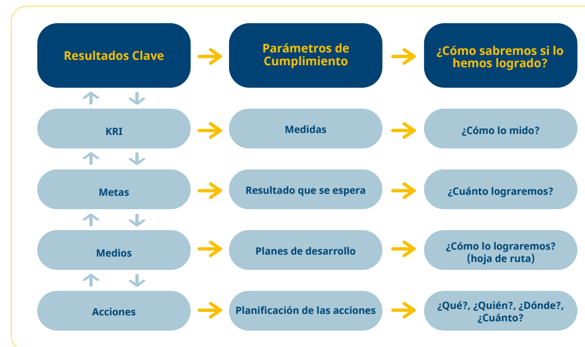
Figura 5: Adaptación de la matriz 3M's de Kovacevic y Reynoso.

Matriz de operacionalización e integración de conceptos y metodologías y cómo se comunican entre sí mediante un flujo de información bidireccional: